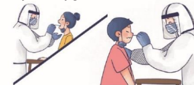
● Výtěr z nosu ● Výtěr z nasofaryngu